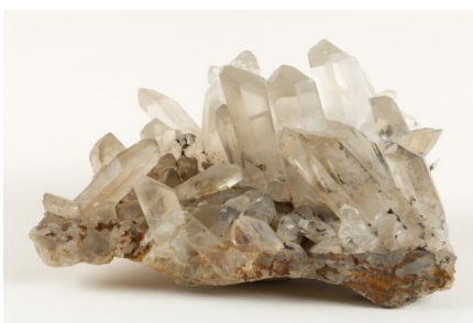
Cristaux de quartz, Musée de Picardie

les armes ou encore la géométrie naturelle et artificielle