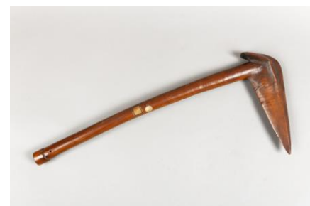
Massue de guerre à tête d'oiseau, Nouvelle Calédonie. Musée de Picardie.