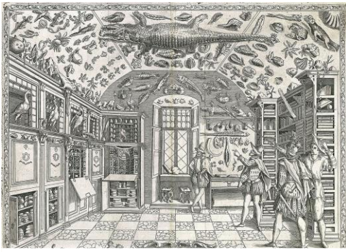
Frontispice de l' Historia Naturale de Ferrante Imperato, Naples, 1599