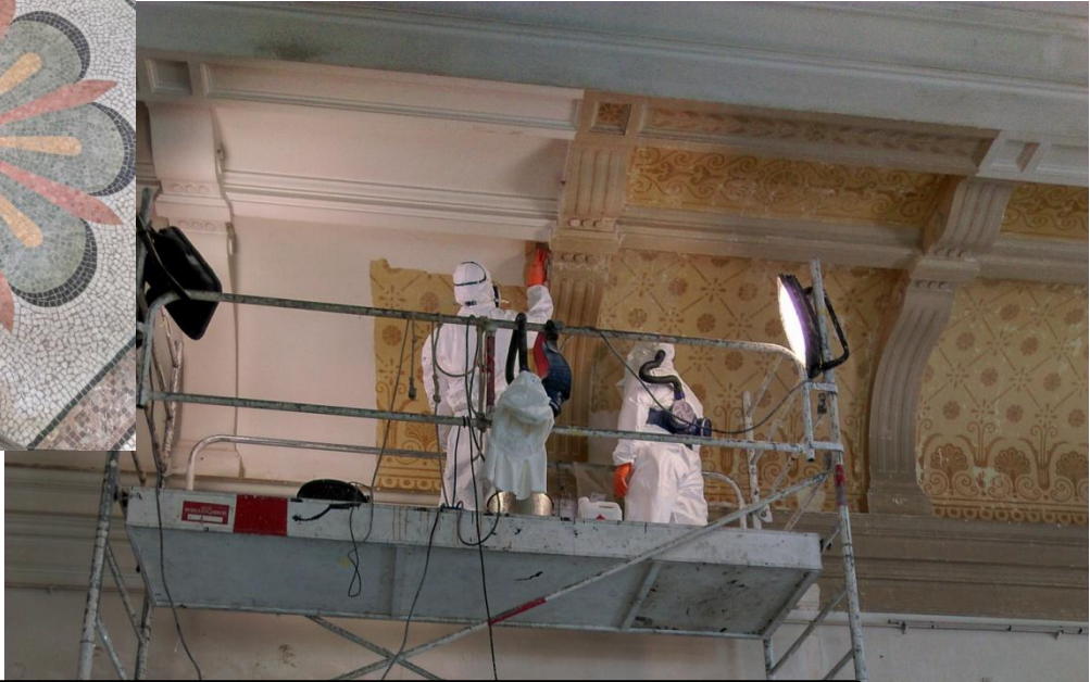
mise au jour des anciens décors