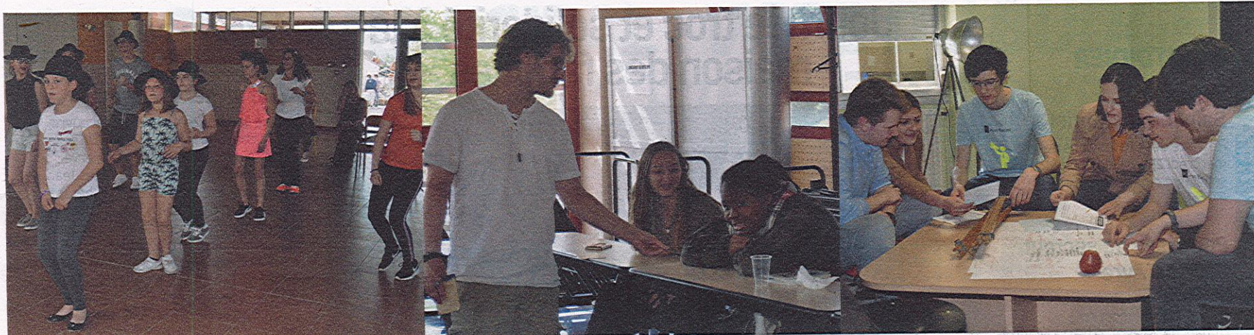
ZUMBA. Une démonstration de zumba s'est déroulée dans le grand hall du lycée. Certains collégiens ont également participé à cette démonstration dynamique et rythmée.