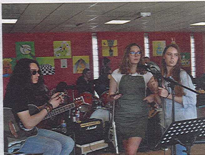
CLUB DE CHANT. Après quelques ajustements entre les chanteuses et le musicien, le mini-concert pouvait se poursuivre, dans une ambiance électrique.