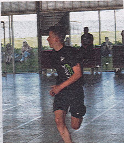
FOOT EN SALLE. Le football en salle a permis à des élèves de s'initier à cette autre forme de football.