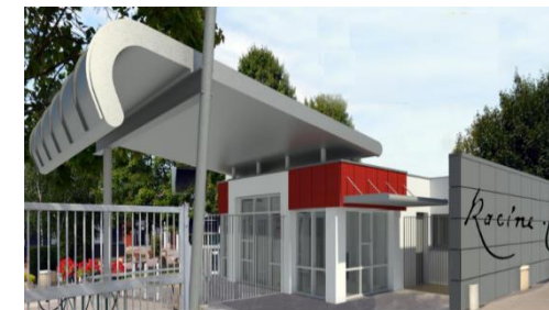
Lycée Polyvalent JEAN-RACINE - 80 500 MONTDIDIER